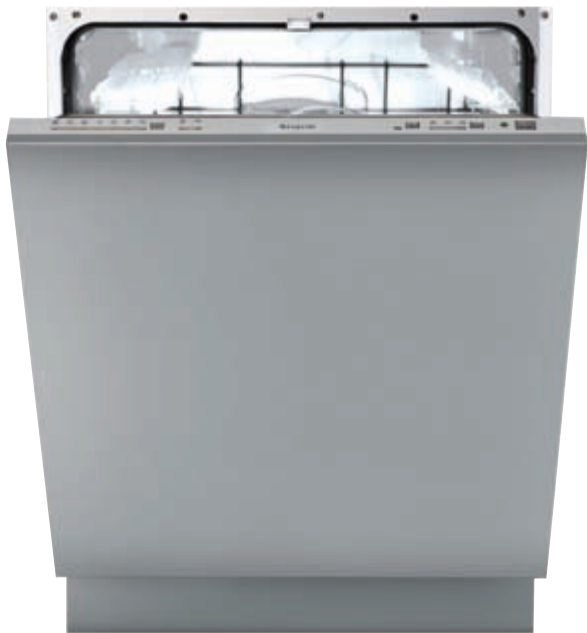
LSI 60 HL

Lavastoviglie integrata a scomparsa totale - Sistema di controllo digitale - Energy Label [consumo, lavaggio, asciugatura] A A A - Rumorosità 37 dB(A) pressione sonora - Asciugatura statica - Capacità 12 coperti I.E.C. - 7 programmi di lavaggio - 6 temperature di lavaggio, 40-50-55-60-65-70°C - Funzione mezzo carico - Delay timer - Cesti ad organizzazione flessibile - Spie riserva sale e brillantante - Sistema integrato antiallagamento - Piedini posteriori regolabili frontalmente - Porta piatta in acciaio KIT LSI PX optional - Schema di incasso E 1