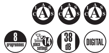
LSI 60 14 HL

Fully integrated dishwasher - Electronic control - Energy Label [energy, washing, drying] A A A - Noise level 38 dB(A) acoustic pressure - Condensation drying - 14 place settings I.E.C. - 8 programmes - 3 in 1 tablet programme feature - 6 washing temperatures, 40-45-50-55-65-70°C - Half load function - Delay timer - Adjustable upper basket - Digital display - Rear feet can be regulated from the front - Aquastop flood protection - Optional stainless-steel cover KIT LSI PX - Built-in plan E 1