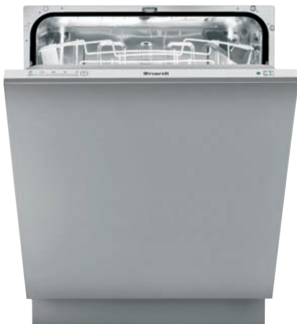
LSI 60 12 SH

Lavastoviglie integrata a scomparsa totale - Sistema di controllo digitale - Energy Label [consumo, lavaggio, asciugatura] A A A - Rumorosità 40 dB(A) pressione sonora - Asciugatura statica Capacità 12 coperti I.E.C. - 5 programmi di lavaggio - 4 temperature di lavaggio, 40-50-55-70°C - Cesto superiore regolabile - Piedini posteriori regolabili frontalmente - Aquastop sistema integrato antiallagamento - Porta piatta in acciaio KIT LSI PX optional - Schema di incasso E 1