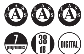
LSI 60 12 HL

Fully integrated dishwasher - Electronic control - Energy Label [energy, washing, drying] AAA - Noise level 38 dB(A) acoustic pressure - Turbo drying - 12 place settings I.E.C. - 7 programmes - 3 in 1 tablet programme feature - 6 washing temperatures, 40-45-50-55-65-70°C - Half load functions - Delay timer - Digital display - Fully adjustable baskets - Aquastop flood protection - Rear feet can be regulated from the front - Optional stainless-steel cover KIT LSI PX - Built-in plan E 1