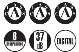
LSI 45 HL

Fully integrated dishwasher, 45 cm - Electronic control - Energy Label [energy efficiency, washing, drying] A A A - Noise level 37 dB(A) acoustic pressure - Condensation drying - 9 place settings I.E.C. - 6 programmes - 5 wash temperatures, 40-48-55-60-70°C - Half load function - Delay timer - Aquastop flood protection - Built-in plan E 2