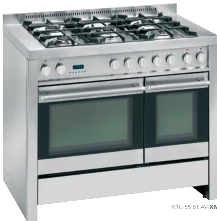
K1G 55 81 AV XN

AV inox nero • stainless-steel and black glass K1G 55 81 AV XN