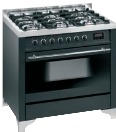
EG 55 52 AV C