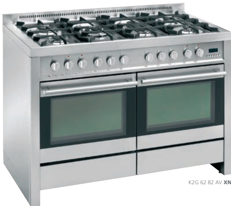
K2G 62 82 AV XN

AV inox nero • stainless-steel and black glass K2G 62 82 AV XN