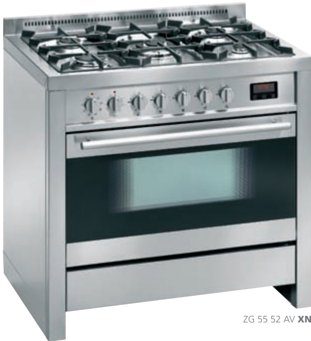
ZG 55 52 AV XN

AV inox nero • stainless-steel and black glass ZG 55 52 AV XN