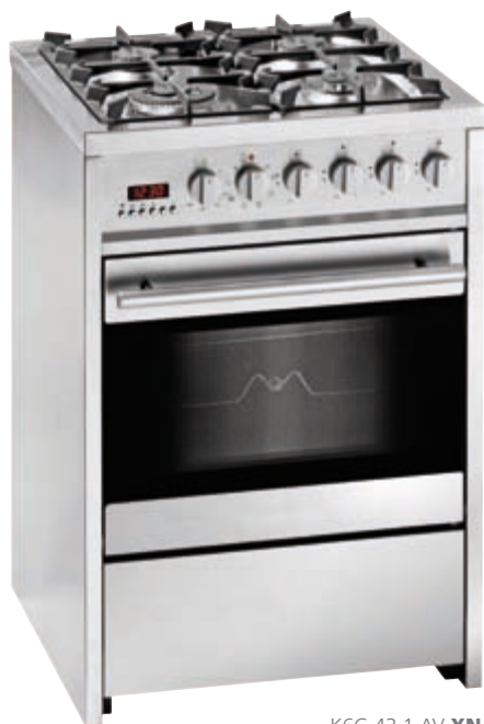
K6G 43 1 AV XN

Cucina a 4 fuochi con forno elettrico ventilato - 8 funzioni - Bruciatore a tripla corona - Accensione elettronica sulla manopola - Griglie in ghisa con gommini antiscivolo e antirumore - Controporta tutto vetro facile da smontare - Programmatore digitale di inizio e fine cottura - Girarrosto - Classe di efficienza energetica A - AV Valvole di sicurezza - Dimensioni LxAxP: 600x920x600 mm