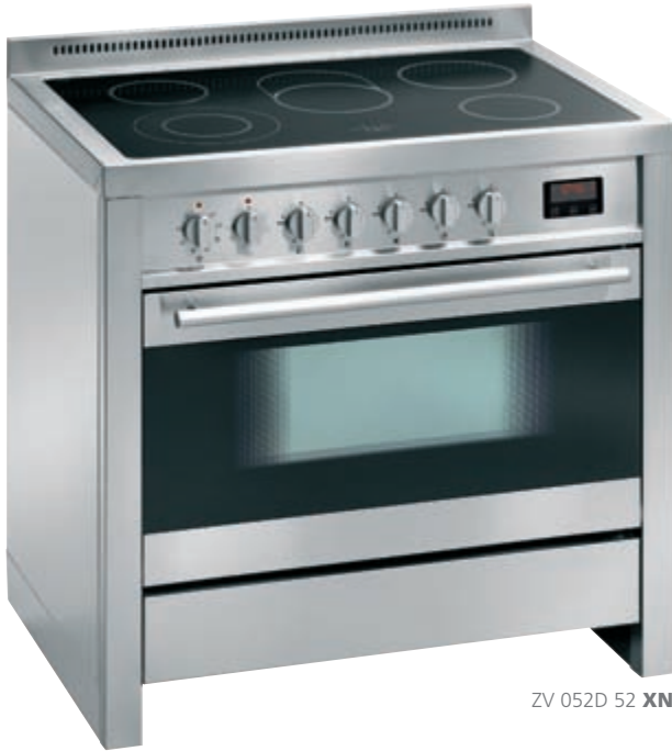
ZV 052D 52 XN

inox nero • stainless-steel and black glass ZV 052D 52 XN