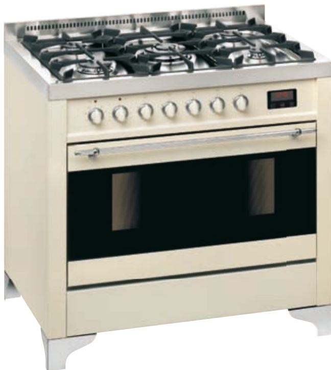
EG 55 52 AV A